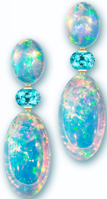
LUCY IN THE SKY