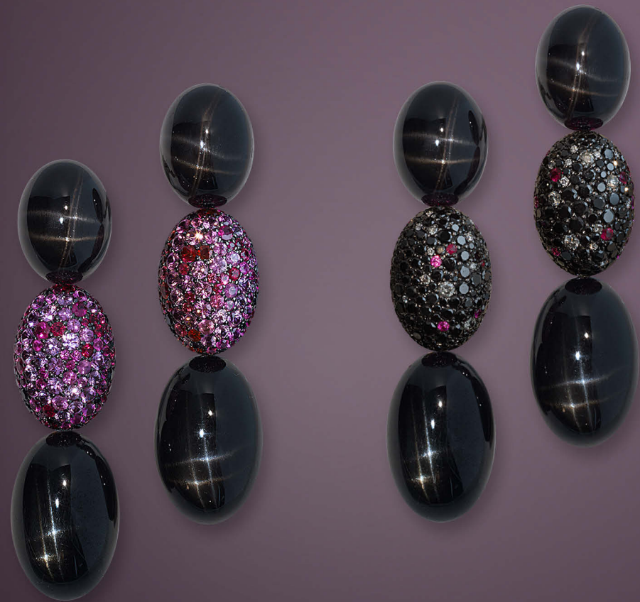
BLACK & PINK STARS