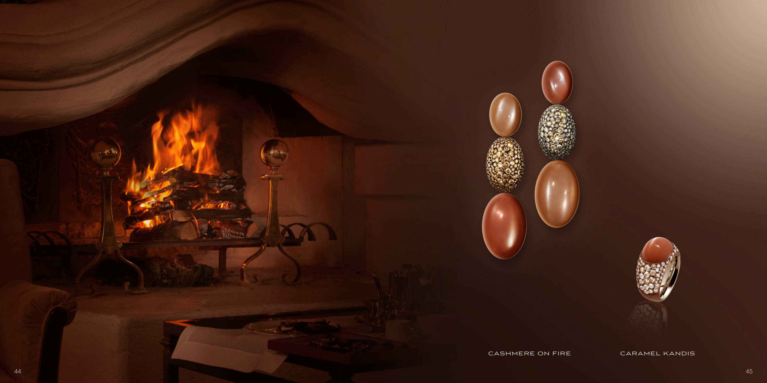
CASHMERE ON FIRE