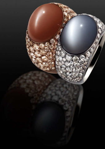
CARAMELL & ICE