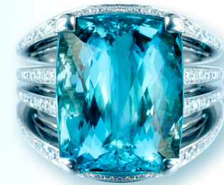
THE BIG BLUE